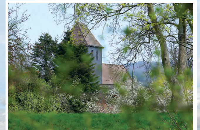
St. Jacobi Kirche