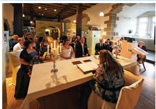
Standesamt im alten Schloss Rodenberg