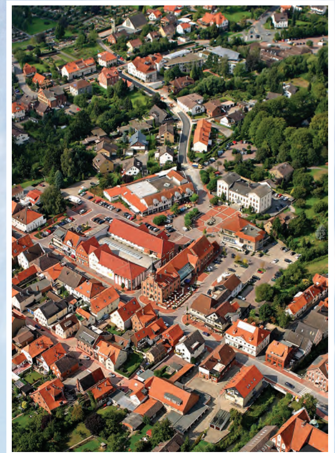
Luftaufnahme der Innenstadt