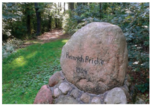
Denkmal des Vereinsgründers Heinrich Fricke im Bürgerpark