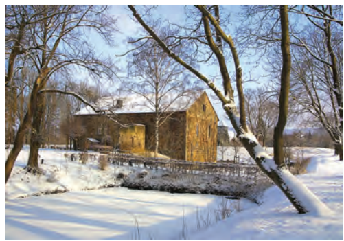
Altes Schloss und Heimatmuseum